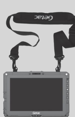
Fixation à la tablette