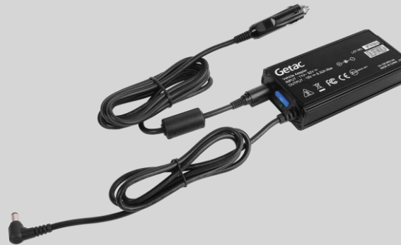
Version prise allume-cigare