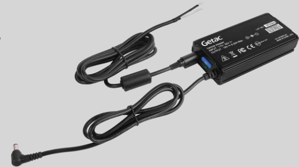
Version fils dénudés