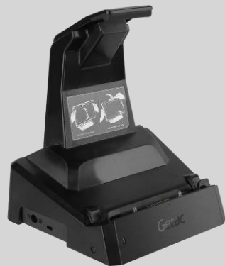
Photo du produit

* UE = E, US = U, UK = K, AU = A, PR = C, TW = T - Cordons d'alimentation