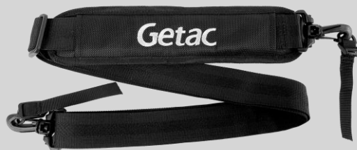
Photo du produit

ID d'unité de gestion des stocks : GMS2X9