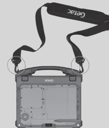
Fixation au clavier amovible